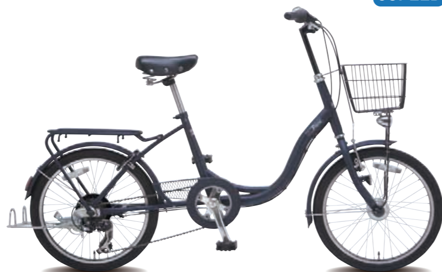
P 20 6S AB