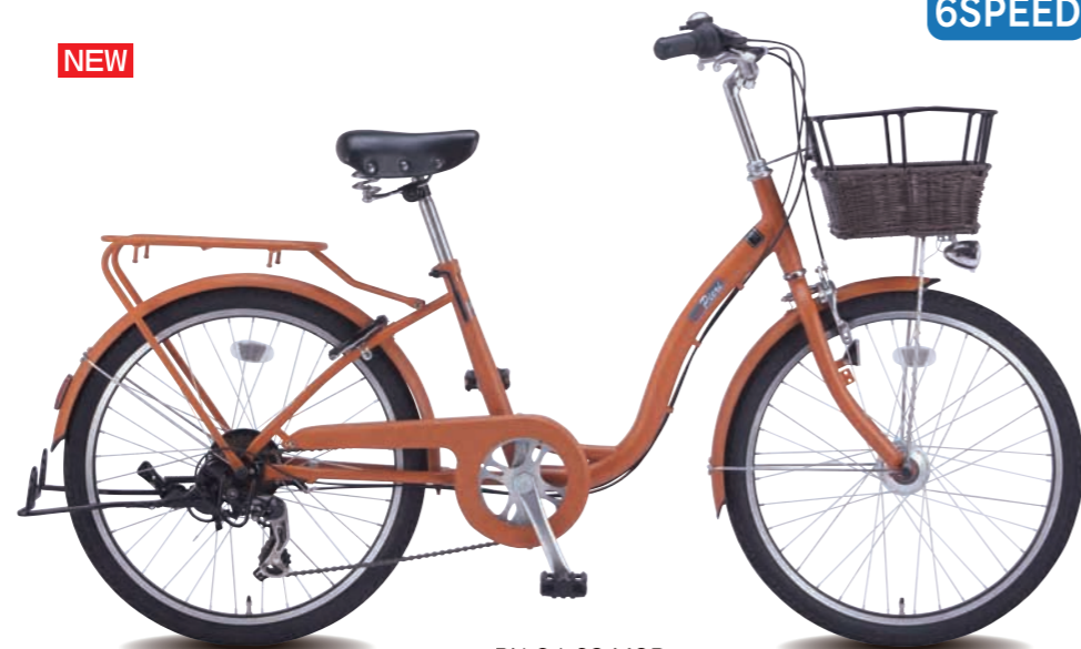
PN 24 6S MOR