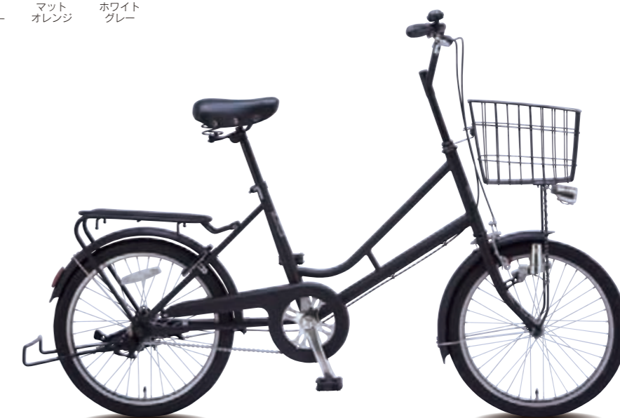
CM 20 MBK