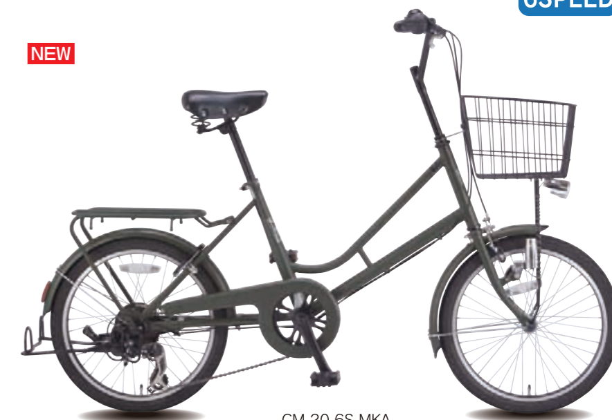
CM 20 6S MKA